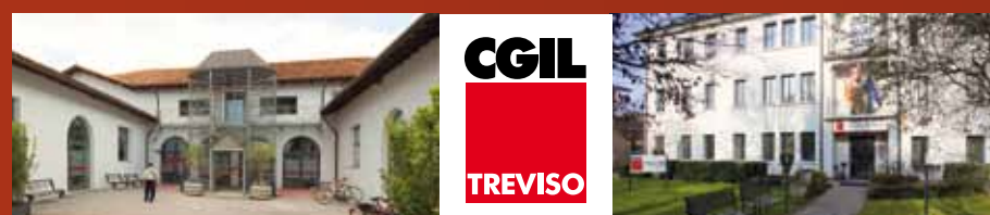
Sede CGIL TREVISO - Via Dandolo, 4 - 10