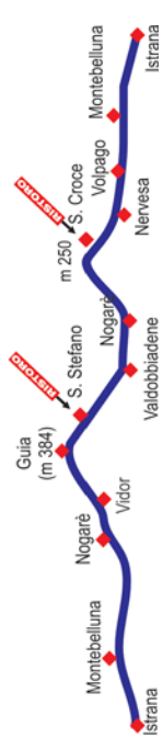
percorso medio 98 km