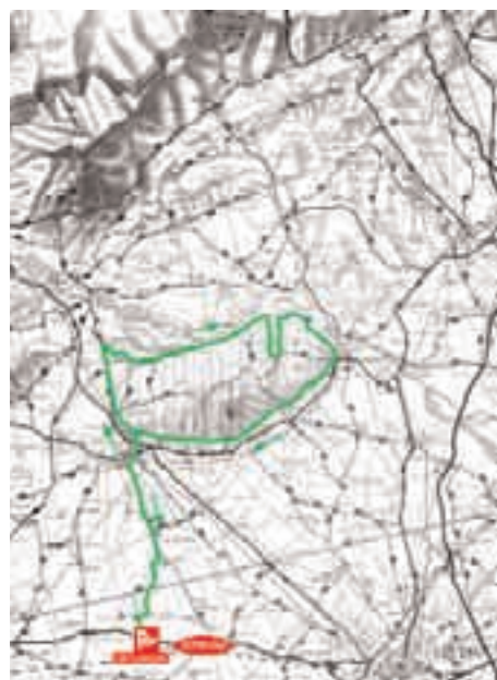
percorso corto 68