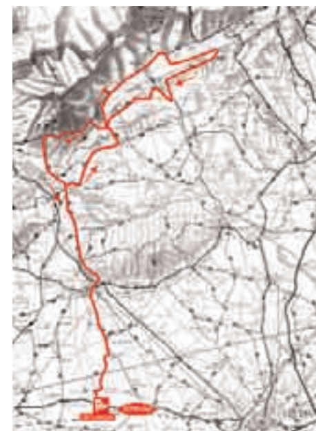
percorso lungo 110