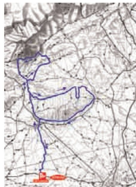
percorso medio 98 km