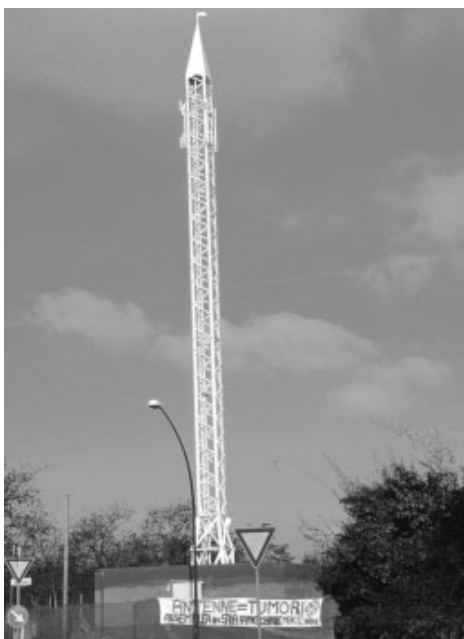
be porsi un obiettivo di qualità: portare i livelli massimi di esposizione dei CEM da 3 V/m a 0,5 V/m; a Treviso, in

E' possibile raggiungere un punto di mediazione tra l'interesse pubblico alla tutela della salute e quello economico dei gestori? Bastereb-