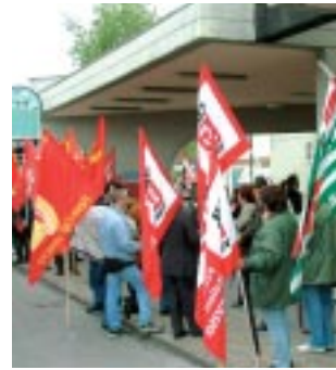
Manifestazione contro le liste d'attesa

Dopo "l'enfatica presentazione" alla stampa del CUPP attuato dalle 3 USL di Treviso (Centro Unico Prenotazioni Provinciale), lo Spi rilancia l'invito ai cittadini a segnalare le loro esperienze quotidiane sui tempi realmente necessari per ottenere prestazioni sanitarie.