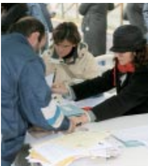
Raccolta firme per la non autosufficienza

Si tratta un risultato straordinario ottenuto grazie al grande impegno dei pensionati e dei lavoratori che hanno presenziato piazze, mercati, centri commerciali e informato in ogni modo i cittadini perchè sostenessero questa importante iniziativa di solidarietà. A loro va il nostro grazie.