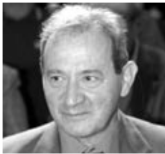
di LORENZO ZANATA*

acquisto veicoli da parte di soggetti portatori di handicap, è necessario che gli autoveicoli siano utilizzati in via esclusiva o prevalente a beneficio di detti soggetti. Inoltre, in caso di trasferimento a titolo oneroso o gratuito, delle autovetture oggetto dei benefici fiscali, prima del decorso del termine di due anni dall'acquisto, è dovuta la differenza fra l'imposta dovuta in assenza di agevolazioni e quella risultante dall'applicazione delle agevolazioni stesse, salvo in presenza di un riacquisto di un nuovo veicolo per mutate necessità dovute all'handicap.