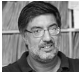
di ROGER DE PIERI*