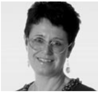
di MARIA PIA MARAZZATO

La finanziaria per il 2007 ha introdotto la possibilità di fruire della detrazione d'imposta nella misura del 19% e/o 20%, su nuove spese ed entro determinati limiti.