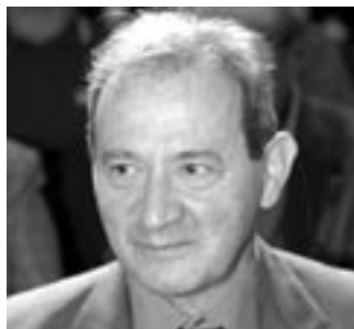
di LORENZO ZANATA*

E' stata, inoltre, prevista una detrazione nella misura del 20%, per le spese documentate e sostenute per la sostituzione, nel corso del 2007, di frigoriferi e congelatori con analoghi di classe energetica non inferiore ad A+, con un massimo di detrazione di 200 euro per apparecchio in unica rata e di apparecchi televisivi dotati anche di sintonizzatore digitale integrato, sino a un massimo di 1.000 euro di spesa e ai soli contribuenti in regola con il pagamento del canone Rai per l'anno 2007.