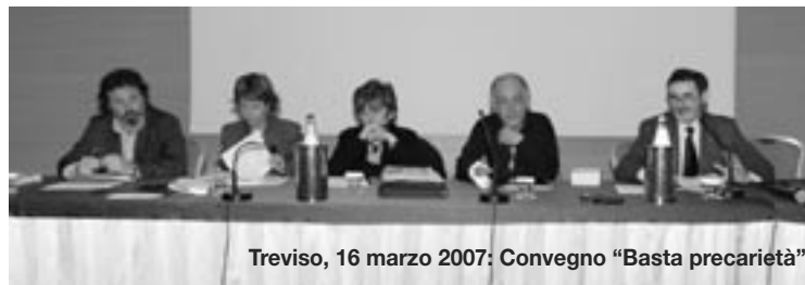
Treviso, 16 marzo 2007: Convegno "Basta precarietà"

verrà liquidato al termine del rapporto, quindi non occorre comunicare nulla. Il TFR maturando resta, in questo caso, in azienda e non verrà versato all'Inps. Se si ha invece un contratto di lavoro superiore a 3 mesi vale il principio del silenzio-assenso e quindi, se non si vuole avviare oggi la previdenza integrativa, si deve comunicare la decisione. Se non si aderisce alla previdenza integrativa il TFR verrà comunque liquidato come già avviene oggi. Nel frattempo, sarà trattenuto dall'agenzia se questa ha meno di 50 dipendenti, oppure verrà versa-