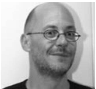
di ANTONIO VENTURA

Speranza di vita: uomini 71,2 - donne 79,0. Tasso di natalità 9,6 e il tasso di mortalità risulta pari a 10,1.