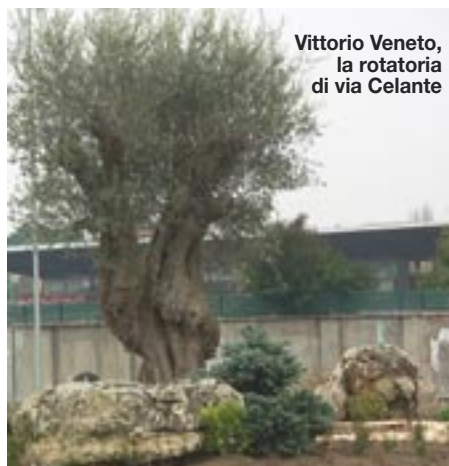
Vittorio Veneto, la rotatoria di via Celante

Ai tempi di "faccetta nera" sul cocuzzolo ci avrebbero messo l'obelisco. Ma questi sono altri tempi, oggi gli obelischi li restituiamo. Cordialmente