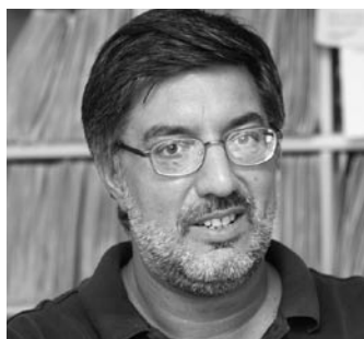
di ROGER DE PIERI

Nello scorso numero di Notizie CGIL, abbiamo evidenziato il diritto a fruire dei periodi di congedo straordinario retribuito anche per assistere il coniuge.