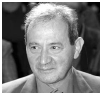
di LORENZO ZANATA*

Per le persone decedute, la dichiarazione deve essere presentata da uno degli eredi. Per i deceduti nel 2006 o entro il mese di febbraio 2007, la dichiarazione deve essere presentata dagli eredi nei termini ordinari, mentre per i deceduti successivamente, i termini sono prorogati di sei mesi e scadono quindi il 17 dicembre 2007 per i versamenti e il 31 dicembre 2007 per la presentazione della dichiarazione.