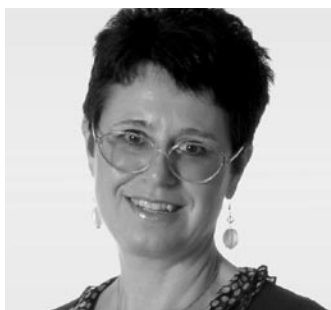
di MARIA PIA MARAZZATO

Il 15 giugno 2007 è scaduto il termine di presentazione della dichiarazione dei redditi con Modello 730.