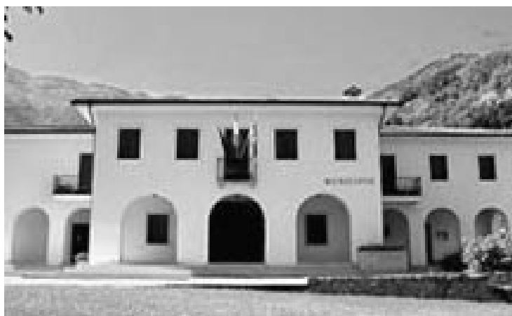
Il Municipio di Miane

Molti lavoratori stranieri si sono rivolti a noi denunciando questa disparità di trattamento considerata iniqua ed arbitraria. Ci chiediamo, effettivamente, quale sia il motivo per il quale due lavoratori stranieri che operano nella stessa azienda e